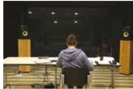
Le Chemin sur Lequel

Concert (work in progress) le 11 octobre Triton, Paris (75)